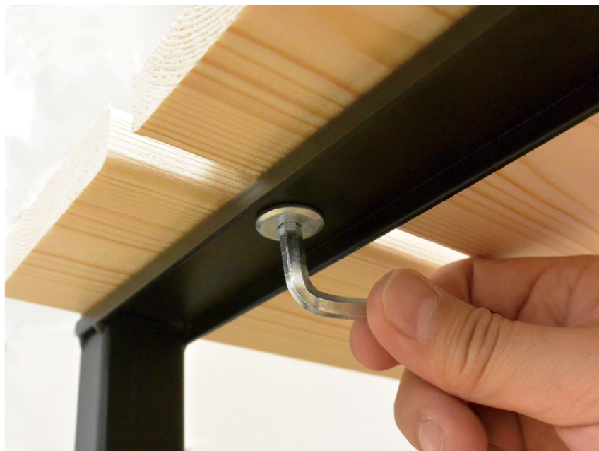
六角レンチで締める