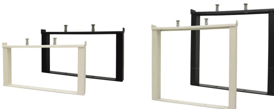
段を追加するための増段セット