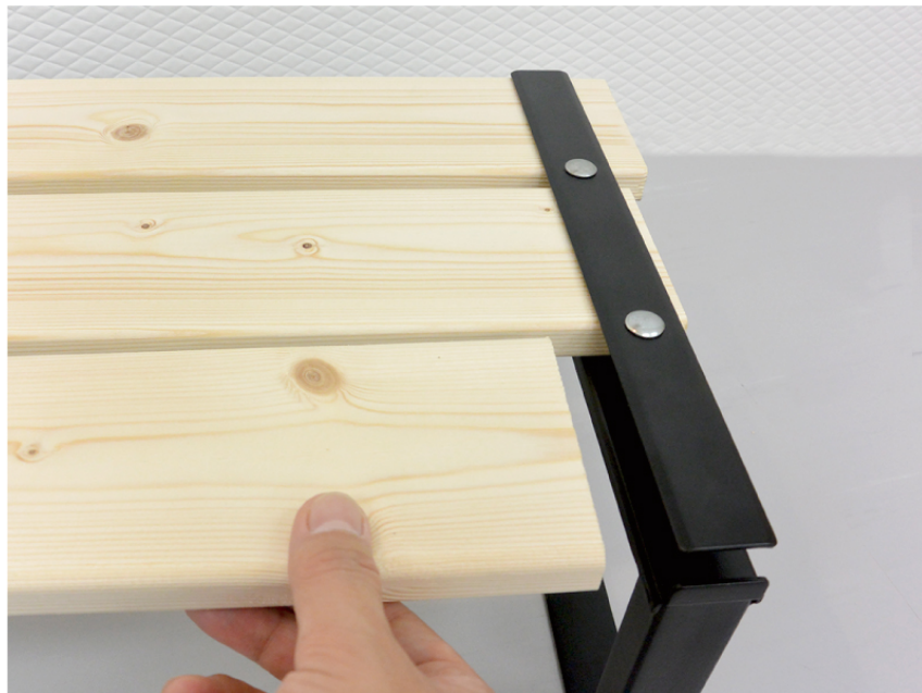
1 × 4 材を3本差し込む