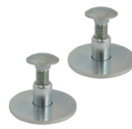
中間接続ネジセット