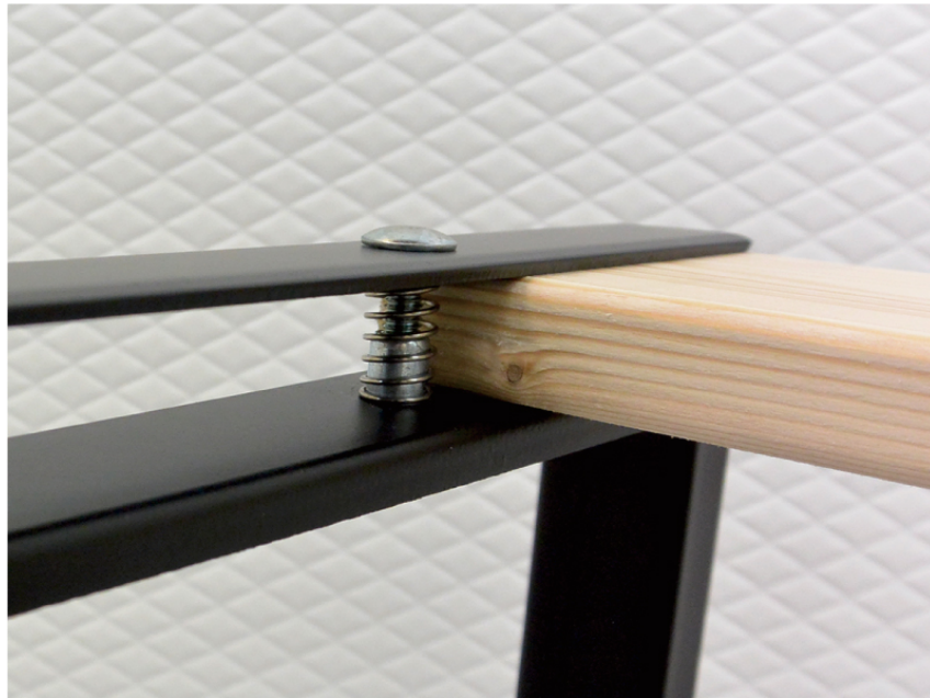
パネで浮いてるから差し込みやすい