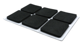
傷つき防止スポンジ