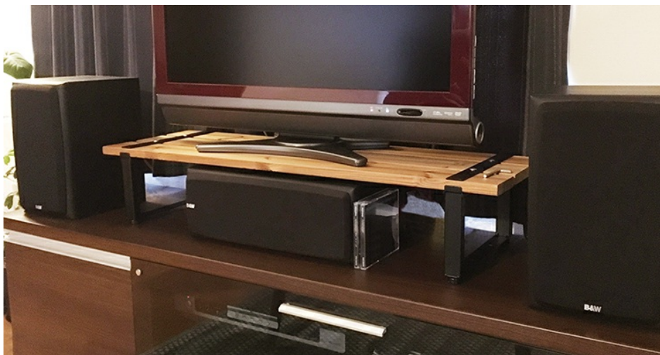
ユーザー使用用途例

簡単に組み立てが可能です、カスタマイズ幅が広いのでD I Y初心者から、セミプロレベルまでレベルに合わせた楽しみ方ができます。